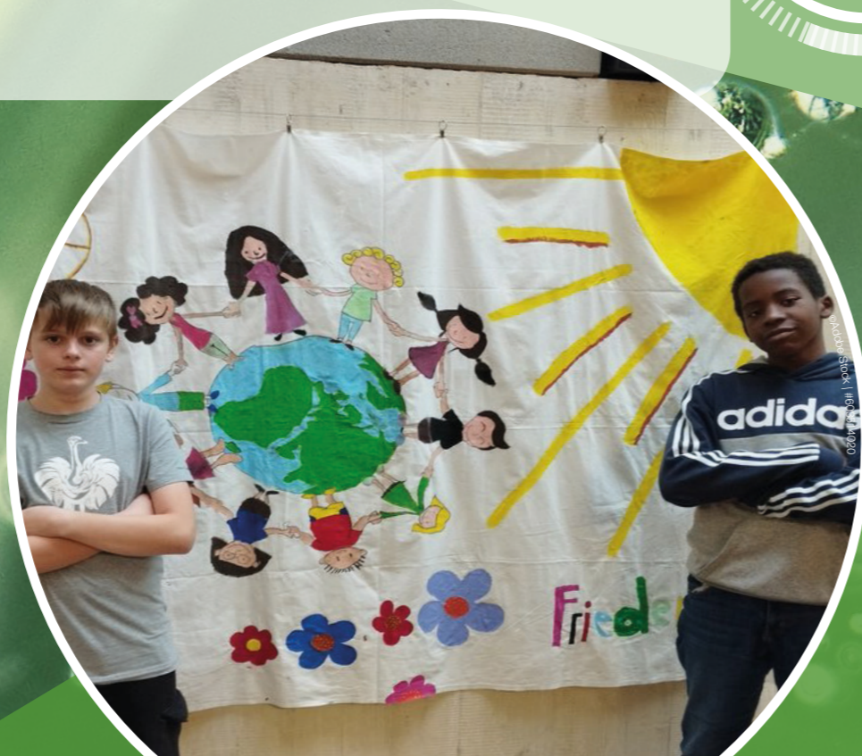
„ÖKOSPRECHER Outdoor Lernen“