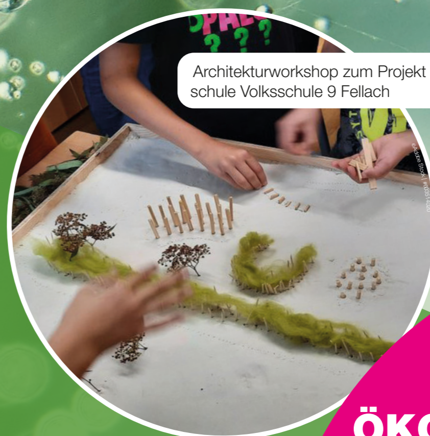
Architekturworkshop zum Projekt „Der geheime Garten“ © Regenbogenschule Volksschule 9 Fellach