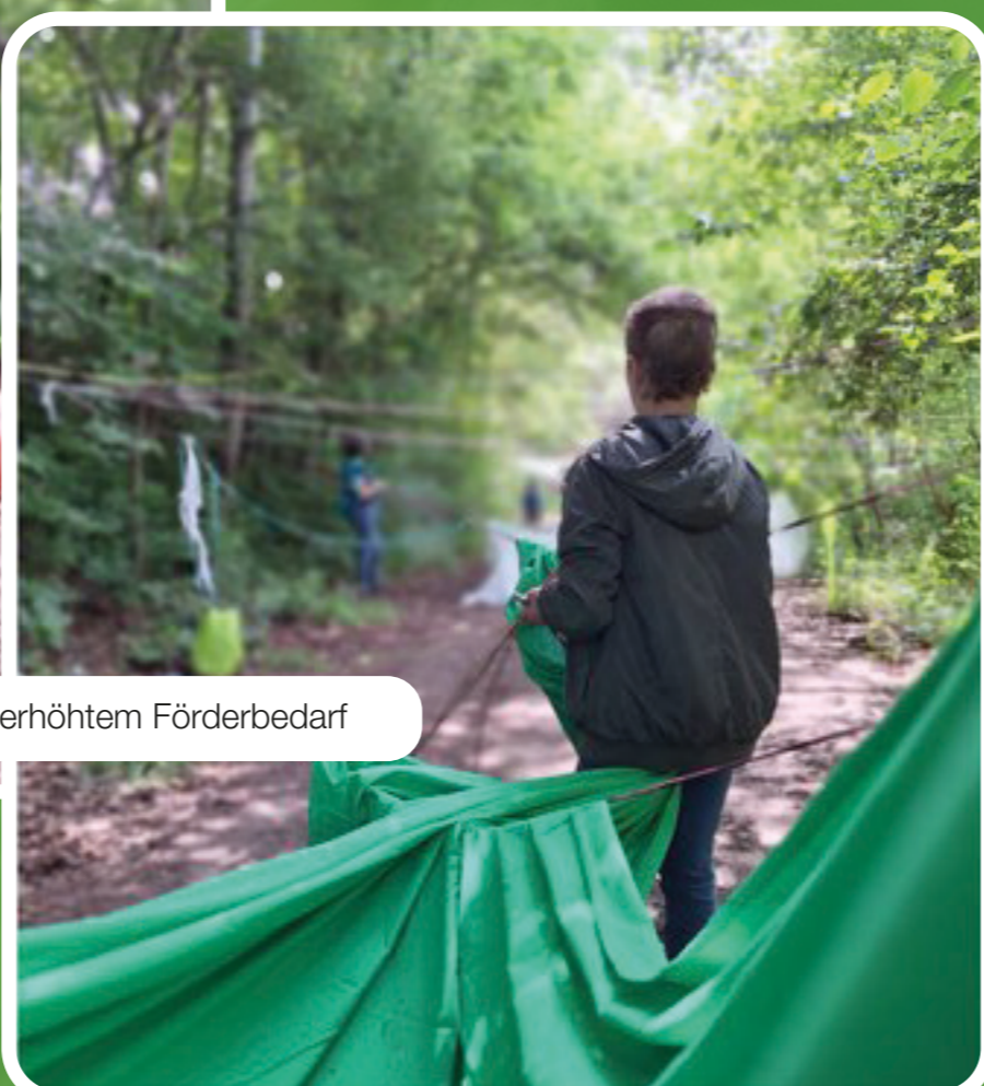
„Kunst im Freien“ © Sonderschule für Schülerinnen und Schüler mit erhöhtem Förderbedarf